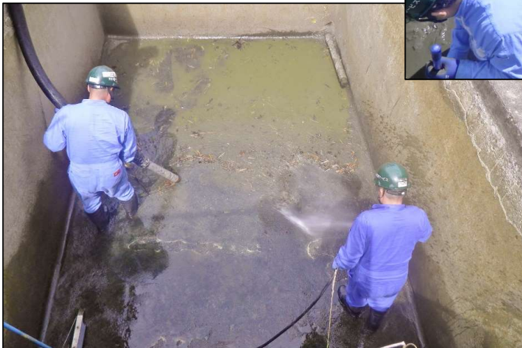
左上：ゴミ拾い 左下：松川自治会 防火水槽清掃 右上：城北自治会 防火水槽清掃